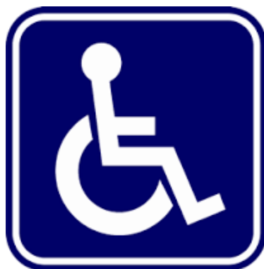
สัญลักษณ์ผู้พิการ